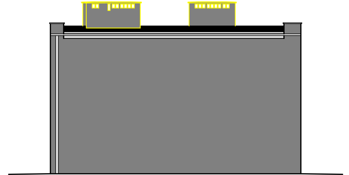
ELEWACJA ZACHODNIA W1 (1:100)