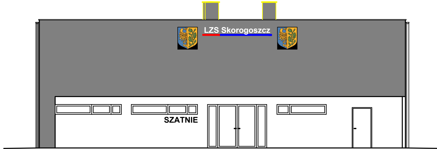
ELEWACJA POŁUDNIOWA W1 (1:100)